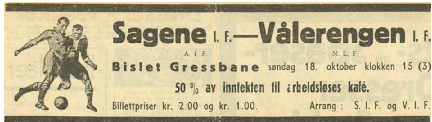
Forliksskam var et nyord i 1936. Annonser for noen slike fotballkamper i Oslo 1936-1939.

Det som er tydelig er at østkant-fotballen fikk et enormt oppsving i perioden 1920 og frem mot krigen. Ikke bare i AIF, men også på borgerlig side. Strong fra Grünerløkka ble bl.a. A-klasse-mester i 1929 mens VIF ble mestere i 1927 samt i 1932-1934. Og Skeid ble et av Norges beste lag mot slutten av 30-tallet og var i cupfinalene i 1939-40. Østkanten hadde erobret fotballen i Oslo.