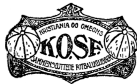
Logoen til K&OSF som ble benyttet 1916-1917.

on skulle flyttes (pga. den enorme Norges Jubileumsutstilling som skulle åpne 15. mai 1914) og at man i denne perioden kun hadde en uferdig Bislet Idrettsplass som nærmest fullgod arena. Men østkantfotballen ga seg ikke og den 3. juni 1914 stiftet de en egen krets: Kristiania & Omegn Sammen-sluttede Fotballklubber (K&OSF).