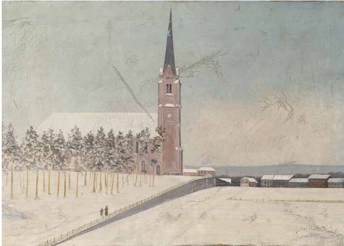
Fotballens vugge i Norge. Maleriet viser i første rekke Uranienborg kirke en fin vinterdag, enten rett før eller rett etter vigslingen i desember 1886. Bak kirken ser man så vidt den splitter nye Uranienborg skole. Bak det lave tregjerdet i høyre forkant ser man derimot Norges første fotballplass: Holteløkken.