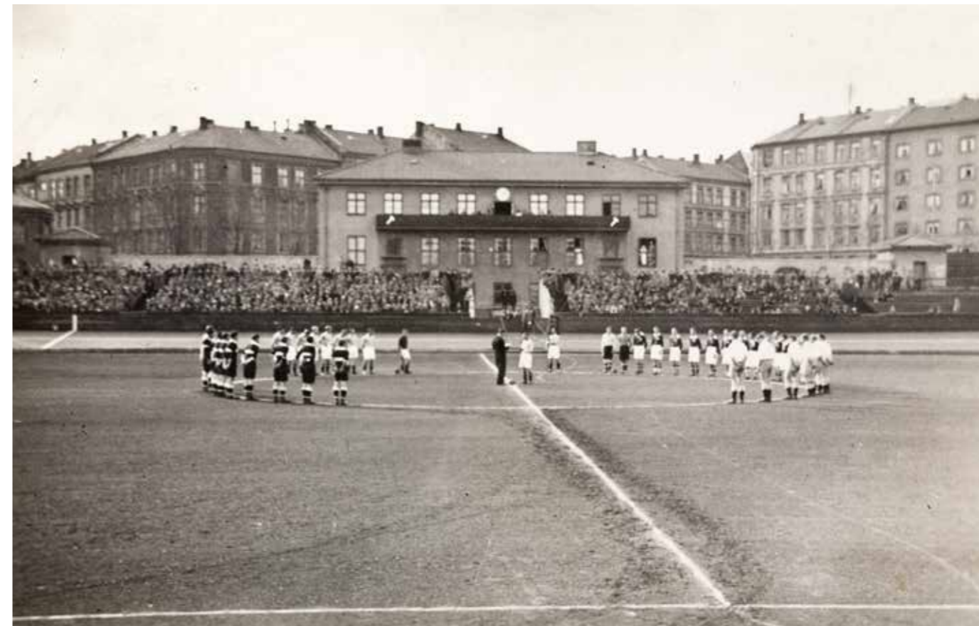
Den store «hjemmebanen» til AIF og arbeiderbevegelsen. Dælenengen Idrettsplass 11. mai 1935. Spartacus feirer 15 år med en turnering hvor de møter Sterling, Sprint (fra Moss) og finske Tampareen Pallo-Veikot.

Men kretsen så på K&OSF som en stor hemsko da de fikk anledning av kommunen til å spille på de samme banene som dem, som Bislet og Dæ-